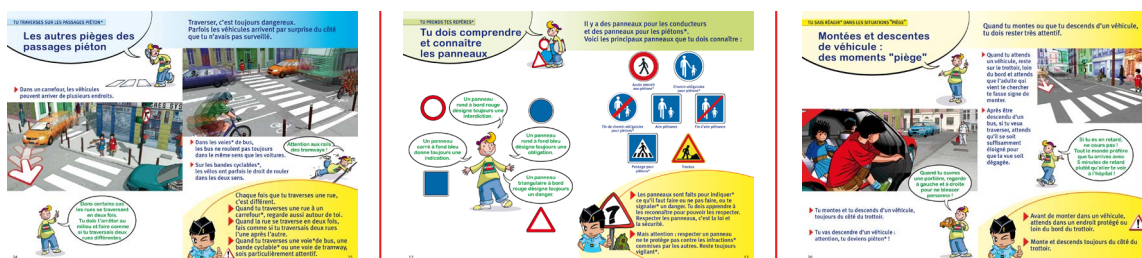
Mallette Kit Pédagogique

La formation est très simple à mettre en place grâce au kit pédagogique complet conçu par des pédagogues. Ce kit contient tous les éléments nécessaires à la formation du Permis Piéton : 30 codes du jeune piéton, 1 DVD, 1 fiche d'examen (à photocopier), 30 Permis Piéton, 1 guide de l'enseignant et une affiche. Exemple avec le kit Gendarmerie :