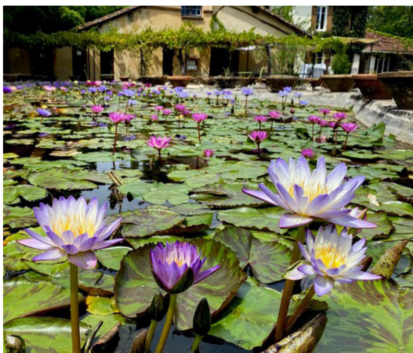
Parc Latour-Marliac

Protection : ISMH en cours et Jardin Remarquable (2004)