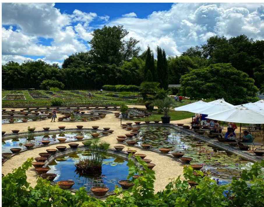
Parc Latour-Marliac

facebook.com/fondationdupatrimoine.aquitaine @fondationdupatrimoineaquitaine