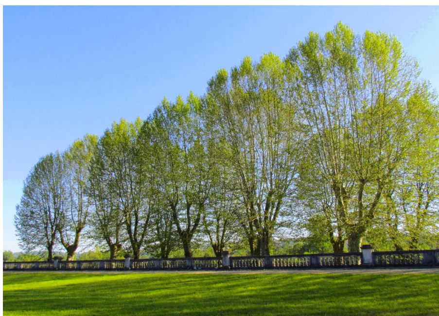
Domaine Chavat à Podensac

Protection MH : ISMH et Jardin Remarquable (2012)