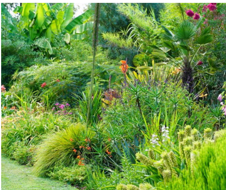
Jardin des Barthes

Protection : ISMH et Jardin Remarquable (2022)