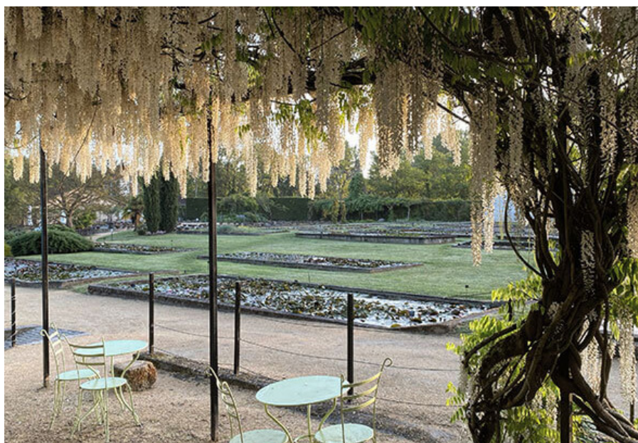
Parc Latour-Marliac