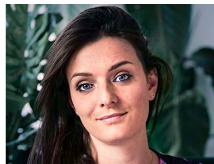
@La Boîte à Curiosité